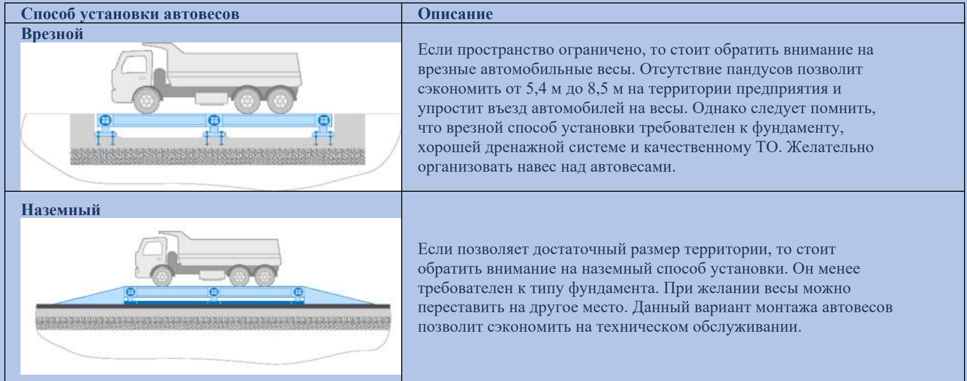
Табл. 3. Способы установки автомобильных весов