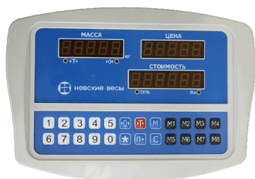
Индикатор модификации ТКС